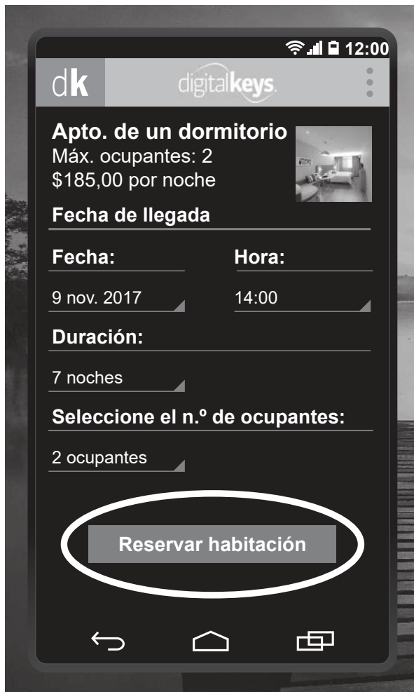
Figura 2: Formulario de reserva de Seaview Hotel