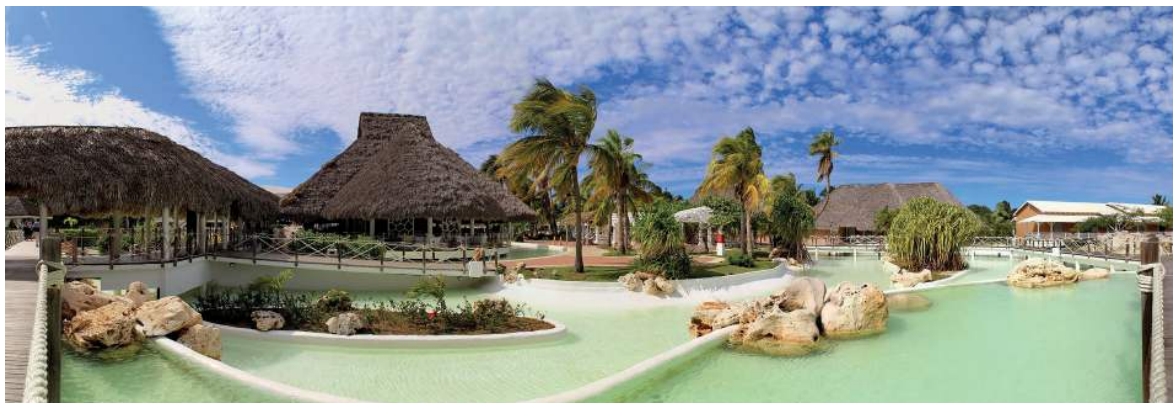
Figura 1: Complejo turístico playero en Sudáfrica

10 El hotel recibe un gran número de huéspedes internacionales, que llegan en vuelos a distintas horas. Con el sistema tradicional de llave de metal, el personal debía estar en el mostrador de recepción durante 24 horas al día, 7 días a la semana, para dar a los huéspedes la llave de su habitación. Para resolver esto, Seaview Cottages ha invertido recientemente en un nuevo sistema de llave móvil, llamado Digital Keys [llaves digitales].